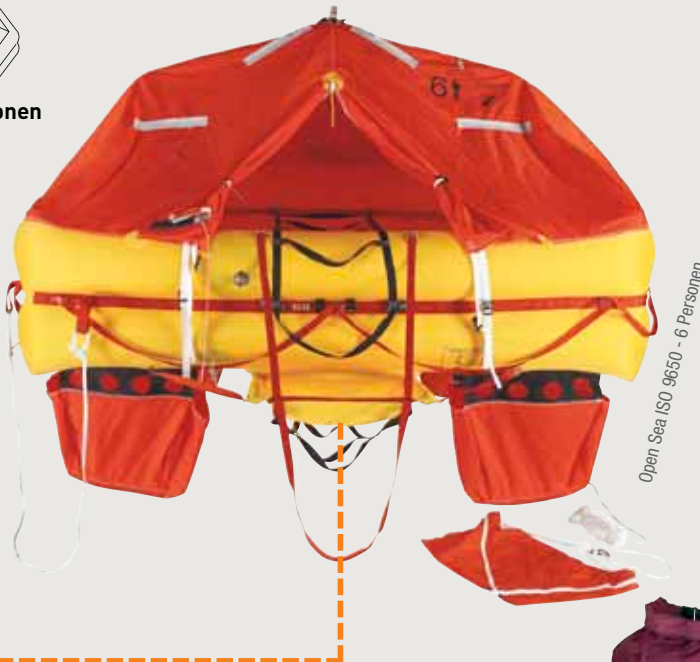
Open Sea ISO 9650 - 6 Personen

liegt. Die Notausrüstung der Version "unter 24 Stunden" ist im innern der Rettungsinsel in einem Packsack verpackt. Falls Sie mehr Ausrüstung für z.B. lange Fahrten oder Hochseeüberquerungen benötigen, kann Ihre Rettungsinsel sehr einfach und schnell in die Version "über 24 Stunden" aufgerüstet werden und zwar mit einem zusätzlichen "Grab-Bag". Schwimmfähig und wasserdicht, enthält der Grab-Bag zusätzliche Notausrüstung, welche Sie für längere Fahrten sicherheitshalber benötigen und ist ausserdem mit einem Befestigungssystem für Tasche oder Container ausgerüstet.